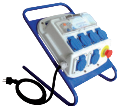
Coffret d'alimentation monophasé 6 prises (P525)