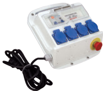
Coffret d'alimentation monophasé 4 prises (P486)